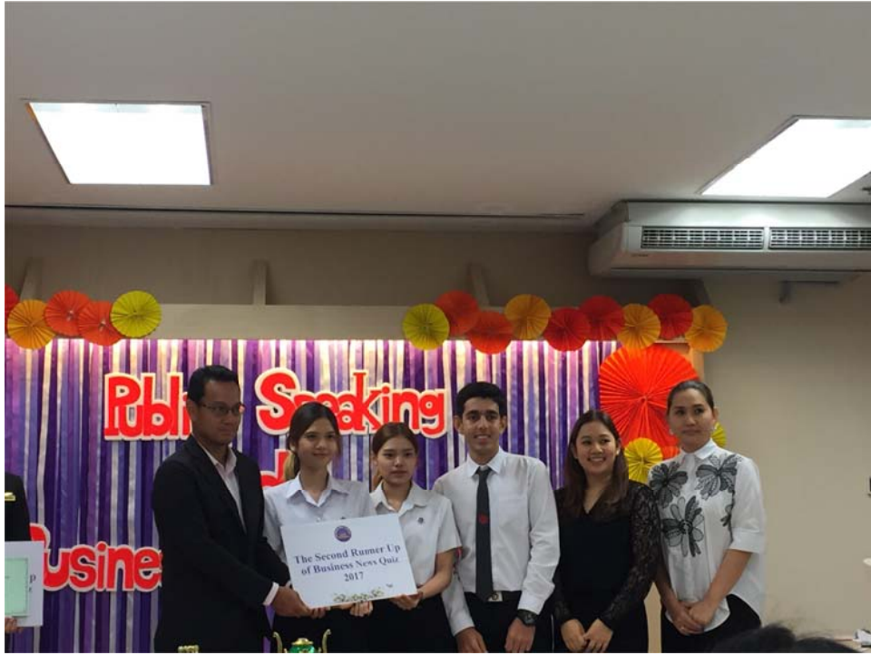
รูปที่ 1 ภาพตอนได้รับรางวัล